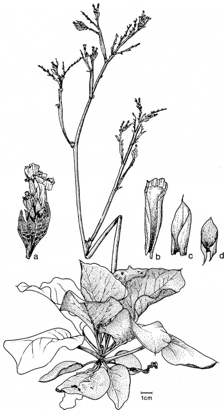
Limonium relicticum R. Mesa & A. Santos; a: espiguilla; b: bráctea interna; c: bráctea media; d: bráctea externa.