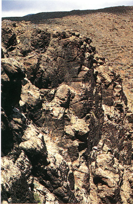
Figura 3.- Hábitat de Helichrysum alucense sp. nov.