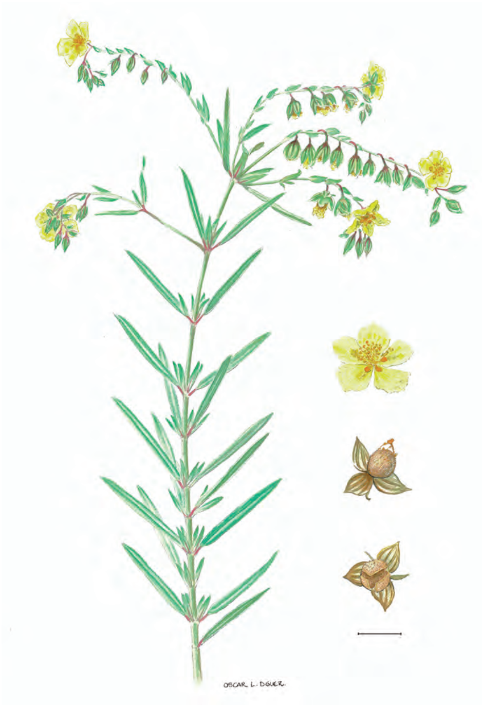
Figura 1.- Helianthemum cirae A. Santos sp. nov. Rama en flor y detalles de la flor, cáliz y cápsula.