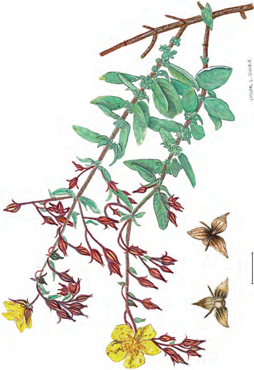
Figura 2.- Helianthemum linii A. Santos sp. nov. Ramas en flor y detalle de cáliz y cápsula.