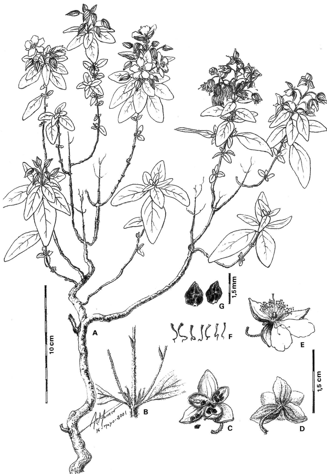
Fig. 2. – Helianthemum aguloi Marrero Rodr. & R. Mesa. A, porte general de la planta; B, detalle de estípulas y brácteas; C, detalle de cápsula y semillas; D, sépalos internos y externos; E, detalle de pétalos, estambres, ovario y pistilo; F, distintas apreciaciones del estilo geniculado hacia la base; G, semillas. [Dibujo A. Marrero]