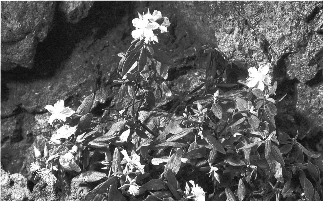
Fig. 6. – Helianthemum aganae Marrero Rodr. & R. Mesa. Aspecto general de la planta.

Petalis obovatis 8-9 × 6-6,5 mm. Staminibus (45-50), 3,3-3,7 mm. Stylo ab medio geniculato incurvato, 3,2-4 mm, stamina superante. Capsula ovoidea, subtrigona, sericea, usque ad 4,3-5 mm. Seminibus (15-20) subtiliter tuberculatis. – Floret Aprile-Maio, frutificat Iunium ad Iulium.