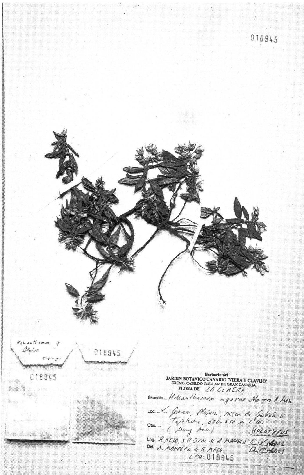
Fig. 4. – Helianthemum aganae Marrero Rodr. & R. Mesa. Holotypus.