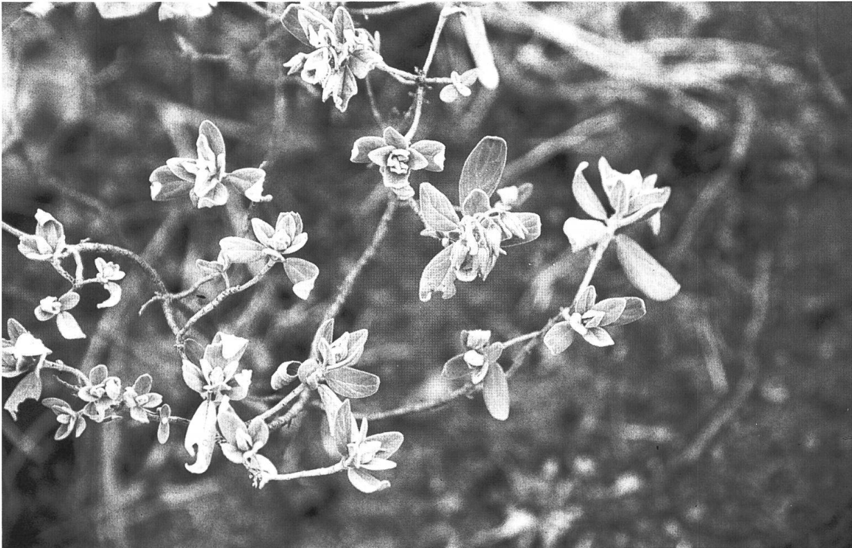
Fig. 3. – Helianthemum aguloi Marrero Rodr. & R. Mesa. Aspecto general de la planta.

cando en ocasiones Davallia canariensis (L.) Sm., y Euphorbia obtusifolia Poir. Otras especies del matorral son Spartocytisus filipes Webb & Berthel., Juniperus turbinata subsp. canariensis , (A. L. Guyot) Rivas Mart. & al., Euphorbia canariensis L., etc.