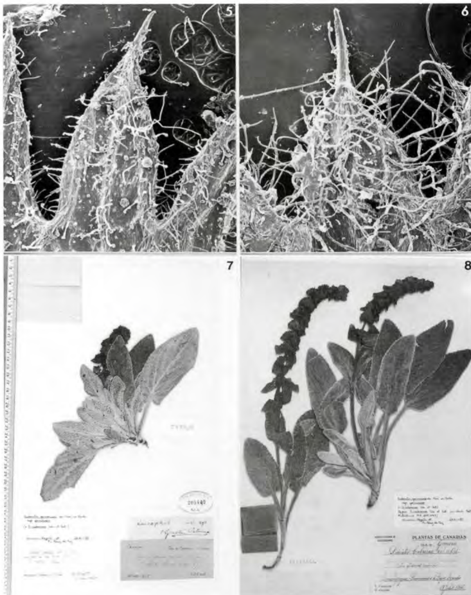
Fig.5 Diente del cáliz en S.gomerana De Noé ex Bolle subsp. gomerana .